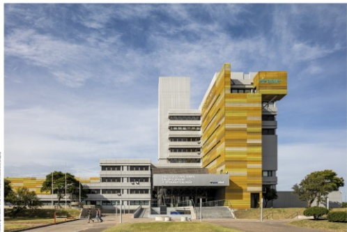
Refuncionalización Edificio Libertad, (2015)