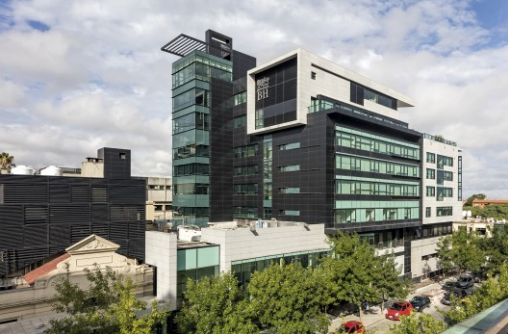
Hospital Británico, Montevideo (1997-2017)