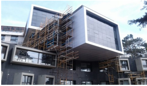
Sanatorio Cantegril, Maldonado (2014-17)