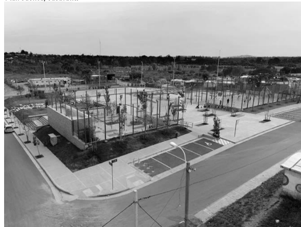
Plaza Casavalle, Parte del plan Cuenca.