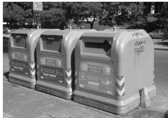
Contenedores reciclables en la ciudad de Montevideo, parte del plan de Gestión de Residuos.