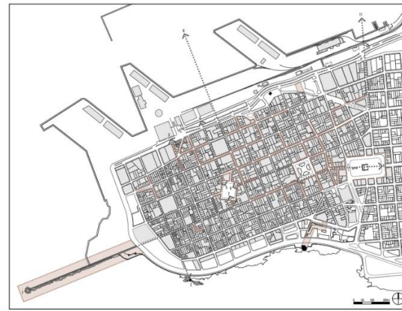
Tramos, Espacios, Objetos y Visuales Protegidas. Plan Especial Ciudad Vieja, 2004.