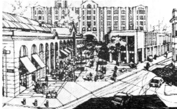
Propuesta Peatonal Pérez Castellano. Grupo de Estudios Urbanos, 1983.