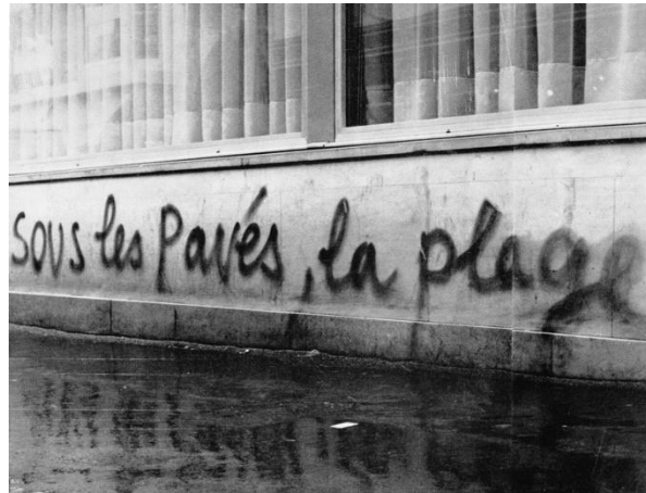
Graffiti realizado en las revueltas de Mayo del 68 ("debajo del asfalto está la playa")