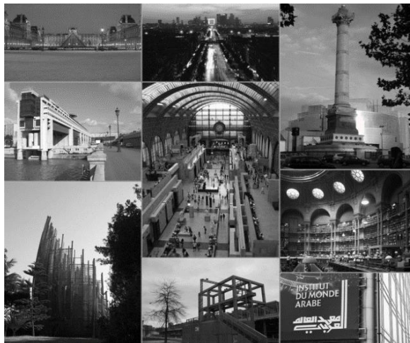
Las grandes obras de François Mitterrand. París, Francia, 1982.