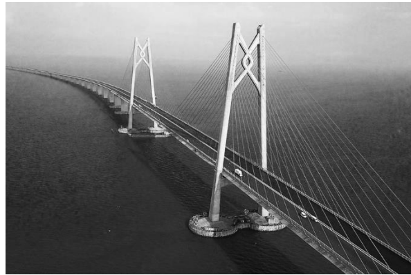
Puente Hong Kong-Zhuhai-Macao (inaugurado el 23 de octubre de 2018)