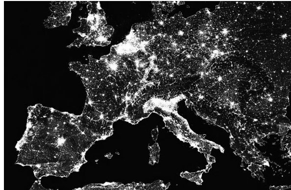
Imagen satelital de Europa en la noche.