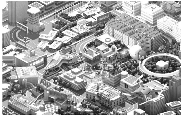
The Silicon Valley [serie] imagen de la secuencia de presentación