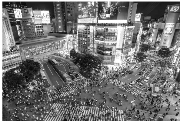
Cruce de Shibuya, Tokio, Japón.