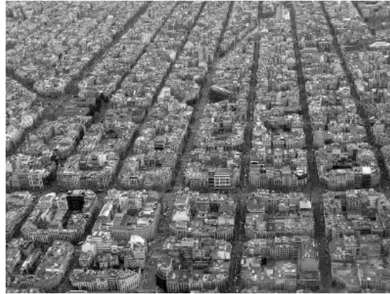
Plan de Ensanche para la ciudad de Barcelona – Ildefonso Cerdá

ALMANDOZ, Arturo: "Consideraciones conceptuales sobre Urbanismo", en Revista Ciudad y Territorio, Estudios Territoriales, Vol. 1, 3ª época, Edit. MOPT, España 1993.