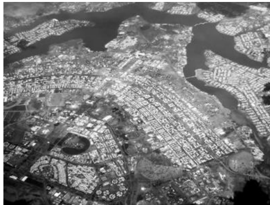
Plan Piloto para la ciudad de Brasilia – Lucio Costa