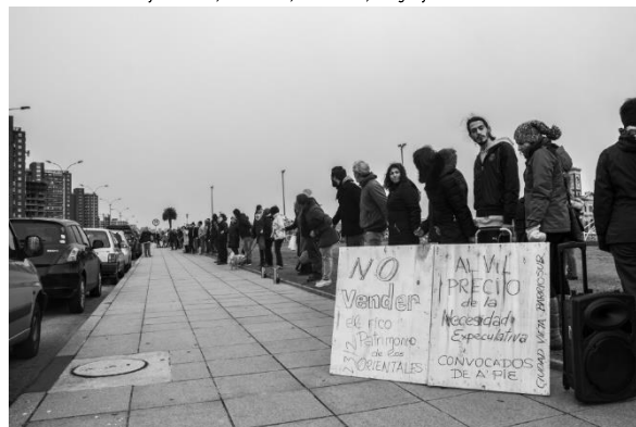
Vecinos de "Por la Rambla Sur" manifestándose por el Dique Mauá. [Participación ciudadana]