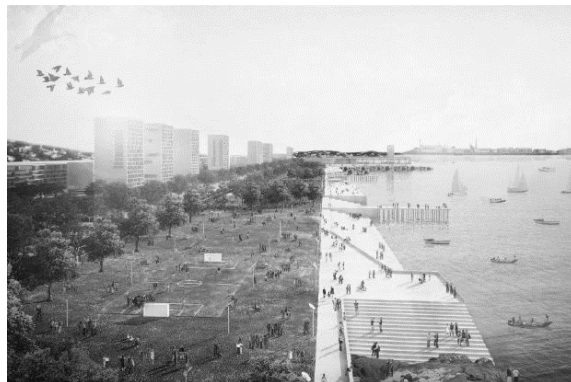
Plan Bahía del Cerro, Montevideo Uruguay. (P.A.I.)

Curso Práctico Teoría del Urbanismo 2° semestre / 2018