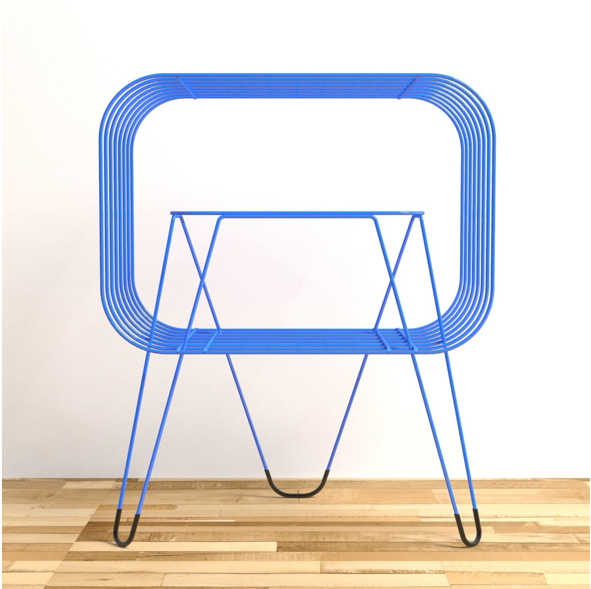
Imagen 3. Render frontal de la “Mesa Quebrada” sobre un piso de madera. Elaboración propia.

Imagen 2. Fotografía de la “Mesa Quebrada” expuesta en la feria de Movelsul 2018, realizada en Bento Gonçalves, Rio Grande do Sul, tomada por el equipo del Premio Salao Design.