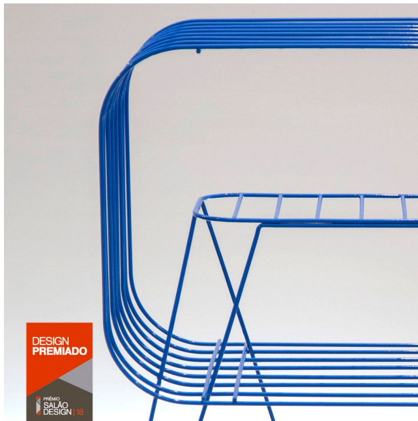
Imagen 1. Fotografía de detalle “Mesa Quebrada” con sello de producto premiado. Expuesta en la feria de Movelsul 2018, realizada en Bento Gonçalves, Rio Grande do Sul, tomada por el equipo del Premio Salao Design.