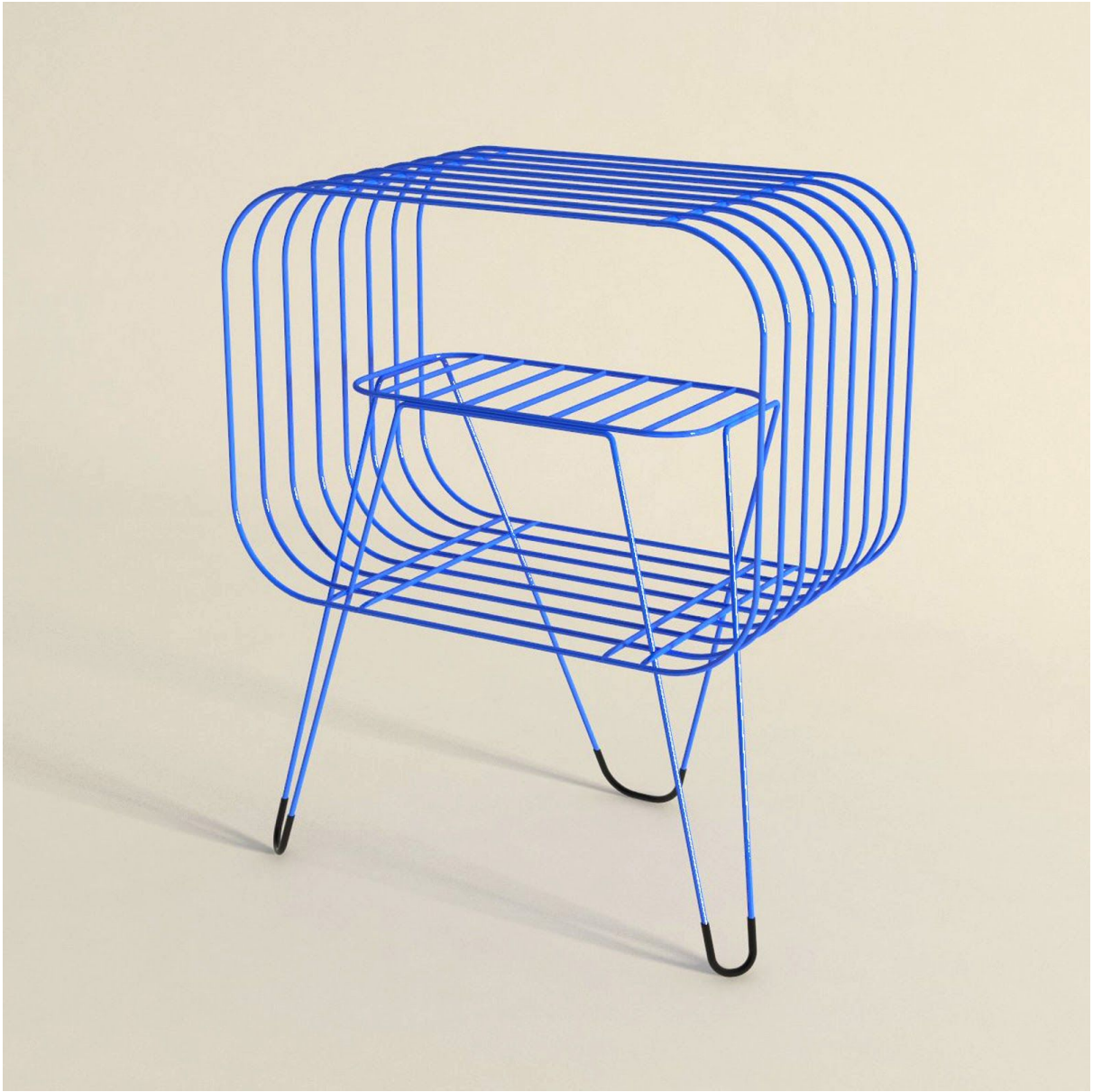
Imagen 4. Render en perspectiva de la "Mesa Quebrada". Elaboración propia.