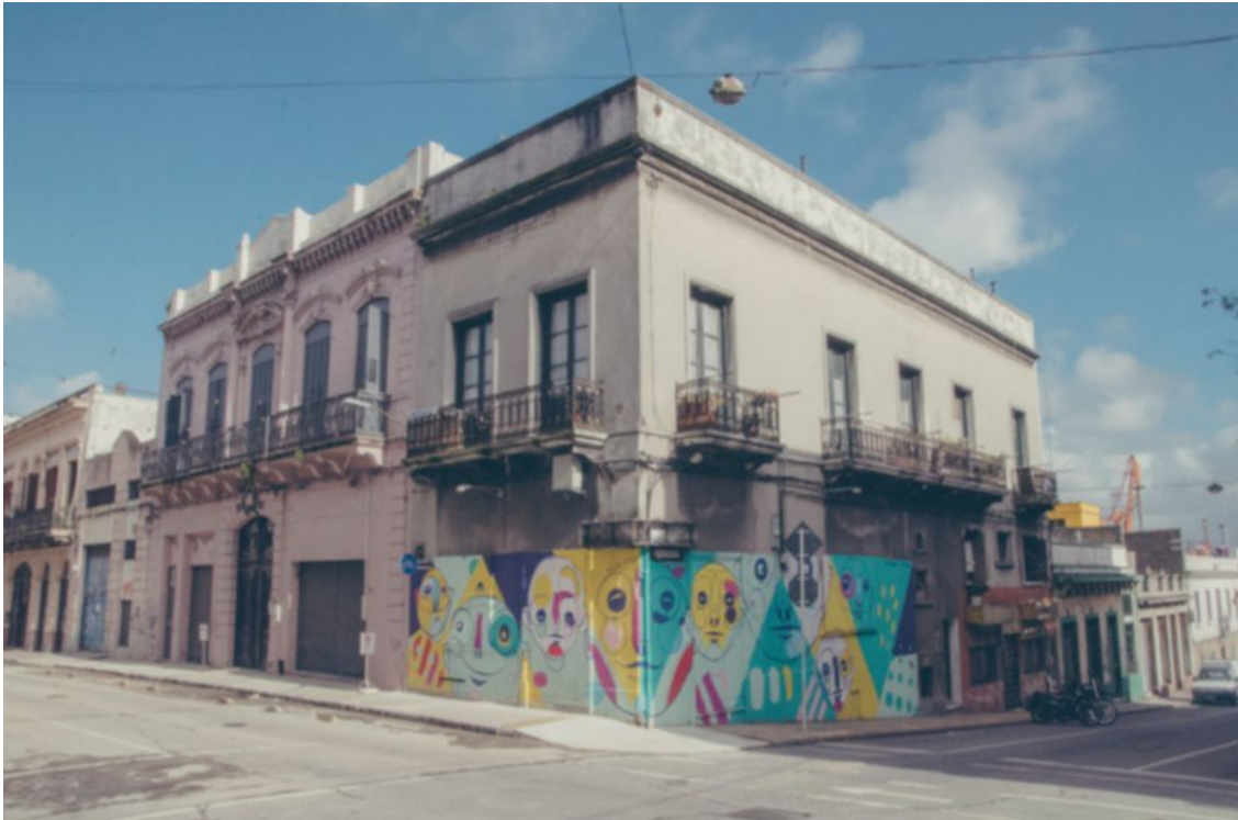
Figura 2. Calles de El Bajo de Ciudad Vieja en Montevideo.

La Ciudad Vieja es de los lugares más frecuentados por turistas que visitan la ciudad de Montevideo. Por esta razón, desde hace algunos años han aparecido iniciativas de inversores privados (uruguayos y extranjeros) para tratar de repoblar el lugar, en el que conviven la actividad financiera, la inmigración, la pobreza, el turismo, la cultura y el patrimonio.