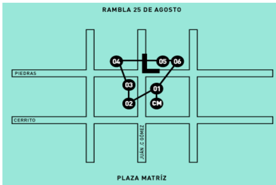
Figura 1. Mapa de El Bajo. [Ilustración].

El Bajo de Ciudad Vieja como proyecto de revitalización urbana surge en octubre de 2014 y su lanzamiento coincide con el festejo del día del Patrimonio. Se ubica en la intersección de las calles Juan Carlos Gómez y Piedras, en el barrio histórico de la ciudad montevideana (figura 1). El objetivo del mismo consiste en hacer resurgir el valor histórico, social, cultural y patrimonial de este lugar, que ha sufrido el deterioro por el paso del tiempo. Según se informa en el sitio web oficial [ http://www.elbajo.com.uy ], los espacios que inicialmente conformaron la propuesta cultural son los siguientes: