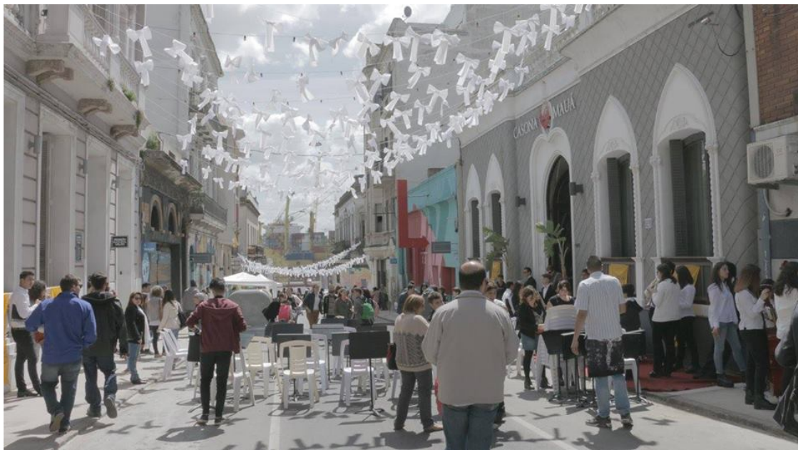
Figura 4. Día del Patrimonio en el El Bajo.

El circuito cultural de “El Bajo” funciona cuando hay eventos e iniciativas puntuales de cada colectivo o artista. Como ejemplo, la propuesta para el día del patrimonio 2015, cuyo eje temático fue la arquitectura, incluyó todo tipo de actividades, proyecciones de cine, exposiciones, juego para niños, música en la calle, variadas propuestas gastronómicas, malabares, ferias, talleres abiertos, etc.