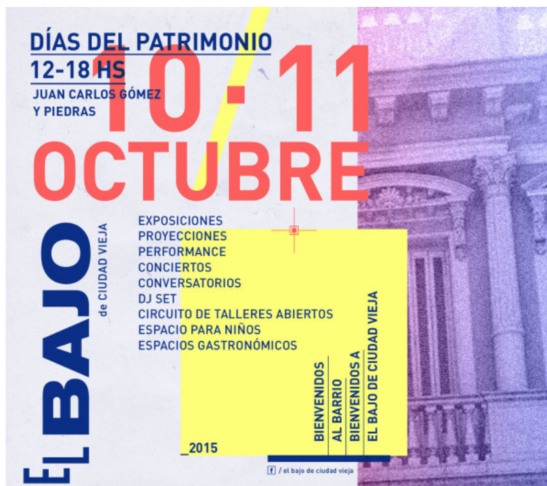
Figura 5. Gráfica de difusión para el día del Patrimonio 2015.

El circuito cultural de “El Bajo” funciona cuando hay eventos e iniciativas puntuales de cada colectivo o artista. Como ejemplo, la propuesta para el día del patrimonio 2015, cuyo eje temático fue la arquitectura, incluyó todo tipo de actividades, proyecciones de cine, exposiciones, juego para niños, música en la calle, variadas propuestas gastronómicas, malabares, ferias, talleres abiertos, etc.