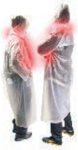
FIGURA 5. EL SUJETO «OCEÁNICO». E. DILLER Y R. SCOFIDIO, BLUR , YVERDON-LES-BAINS, 2002.

de límites reconocibles) no es el sustrato de la regresión, sino de la complejización y yuxtaposición de múltiples regímenes en la relación entre sujeto y mundo exterior. Y regresando a Grosz sobre Uexküll: por un lado, el organismo está en su milieu , activando el mecanismo de «co-evolución»; por otro, el organismo es coextensivo con otros organismos. Aquí radica entonces la imposibilidad de indexar entidades discretas, bien en el par sujeto- milieu u organismo-organismo (es decir, entre organismos ).