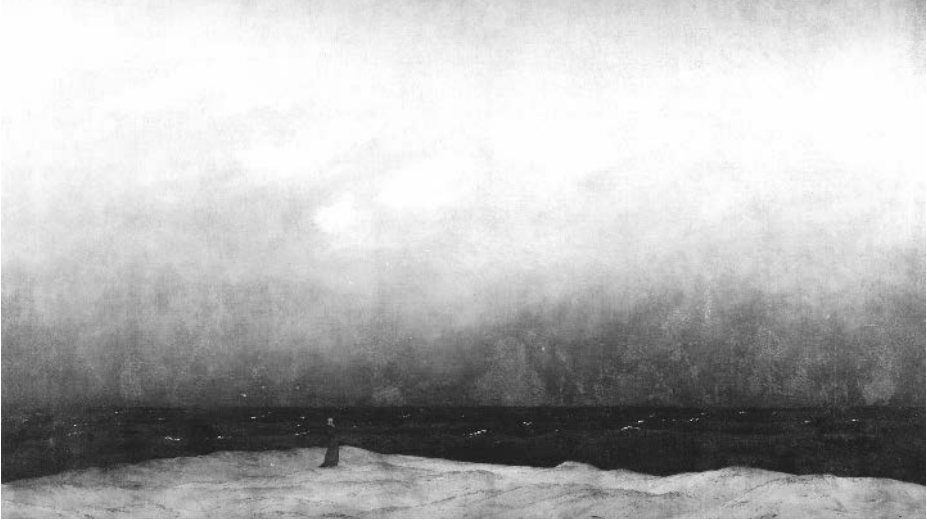
FIGURA 1. CASPAR DAVID FRIEDRICH, MONJE JUNTO AL MAR (MÖNK AM MEER) , 1808-10. ALTE NATIONALGALERIE, BERLÍN.

preedípica (es decir, regresiva), patológica o amoureuse , y que entonces debe deducirse de una compleja interrelación. Es en relación con esta cuestión que la noción de sentimiento oceánico y el edificio Blur resultan paradigmáticos.