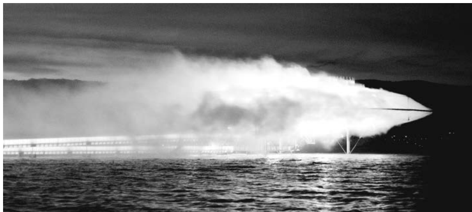
FIGURA 3. UN EDIFICIO HECHO DE NIEBLA. E. DILLER Y R. SCOFIDIO, BLUR , YVERDON-LES-BAINS, 2002.

creación de un paisaje mediático y una arquitectura ausente. Pero el equipo se dividió; Diller y Scofidio, en defensa de su propuesta, respondieron: