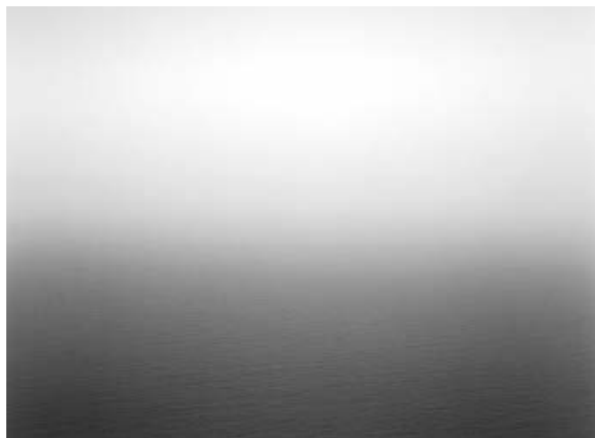
FIGURA 2. HIROSHI SUGIMOTO, AEGEAN SEA, PILION , 1990. SEASCAPES , 1980-2003. TATE MODERN, LONDRES.