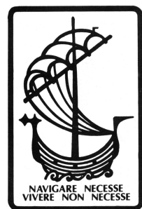
Logotipo de Cuadernos de Marcha