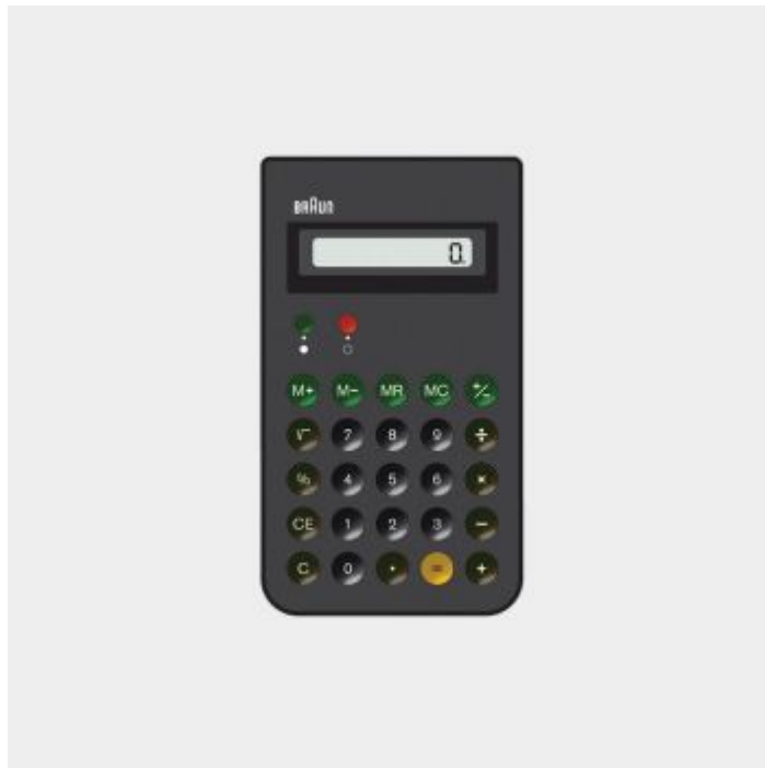
ET 66 calculator, 1987, by Dietrich Lubs for Braun

07. El buen diseño tiene una larga vida. Toda moda es inherentemente pasajera y subjetiva. La correcta ejecución del buen diseño da como resultado productos útiles y atemporales.