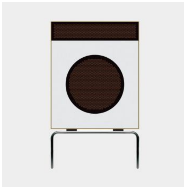
L 2 speaker, 1958, by Dieter Rams for Braun

09. El buen diseño respeta el medio ambiente. Un buen diseño debe de contribuir significativamente a la preservación del medio ambiente mediante la conservación de los recursos y la minimización de la contaminación física y visual durante el ciclo de vida del producto.