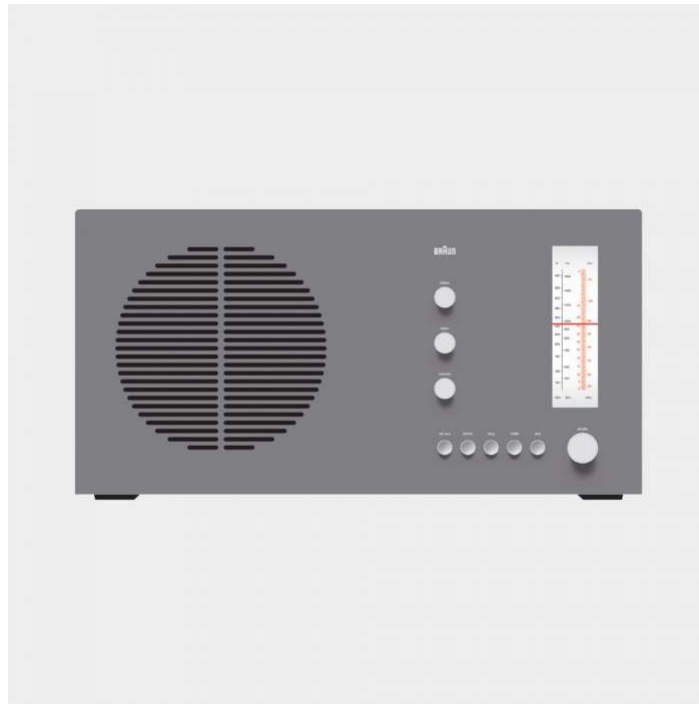
RT 20 tischsuper radio, 1961, by Dieter Rams for Braun

03. El buen diseño es estético. El diseño bien ejecutado no carece de belleza.