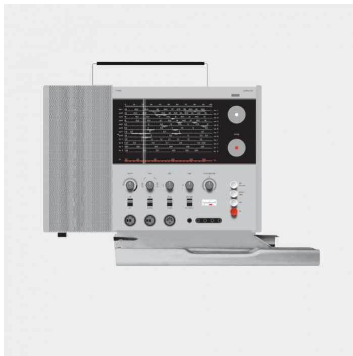
T 1000 world receiver, 1963, by Dieter Rams for Braun

03. El buen diseño es estético. El diseño bien ejecutado no carece de belleza.