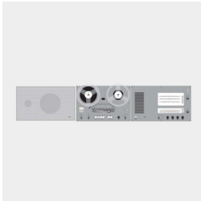
L 450 flat loudspeaker, TG 60 reel-to-reel tape recorder and TS 45 control unit, 1962-64, by Dieter Rams for Braun

05. El buen diseño es honesto. Un diseño honesto nunca intenta falsificar el auténtico valor e innovación del producto dado. Asimismo, un diseño verdaderamente honesto nunca trata de manipular al consumidor mediante promesas de una utilidad apócrifa, inexistente o más allá de la realidad física del producto.