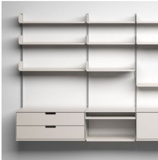
606 Universal Shelving System , 1960, by Dieter Rams for Vitsoe

09. El buen diseño respeta el medio ambiente. Un buen diseño debe de contribuir significativamente a la preservación del medio ambiente mediante la conservación de los recursos y la minimización de la contaminación física y visual durante el ciclo de vida del producto.