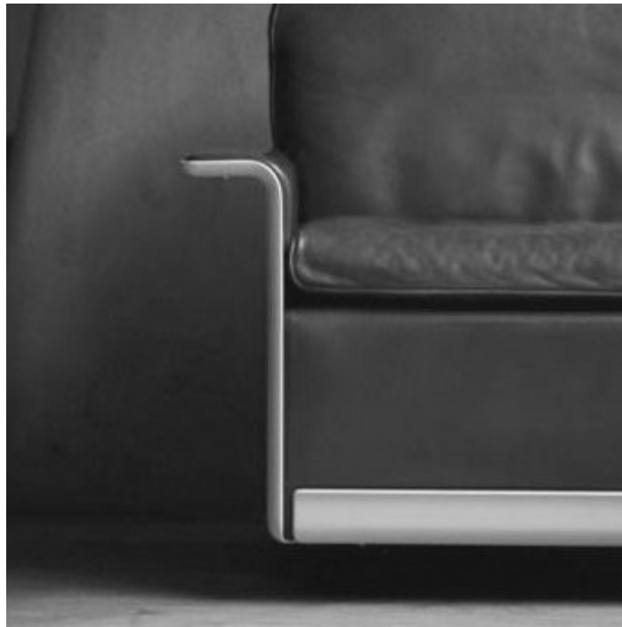
620 Chair Programme , 1962, by Dieter Rams for Vitsoe

07. El buen diseño tiene una larga vida. Toda moda es inherentemente pasajera y subjetiva. La correcta ejecución del buen diseño da como resultado productos útiles y atemporales.