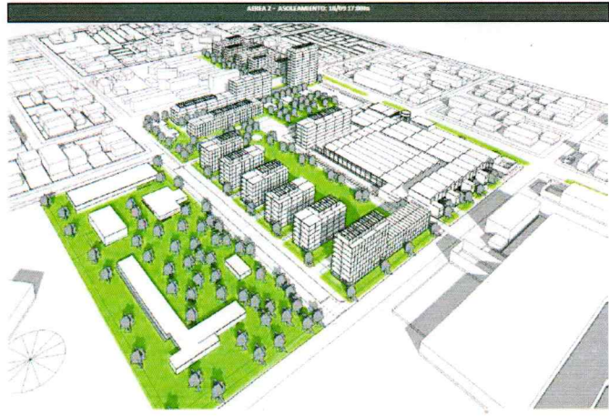
Proyectos Urbanos de detalle "Raincoop" y "Ex Paylana" MVOTMA 2019